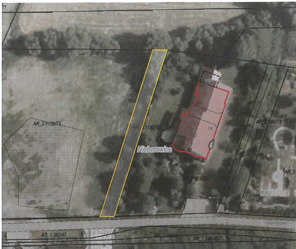
Rysunek 1 Działka przeznaczona do sprzedaży zaznaczona kolorem żółtym